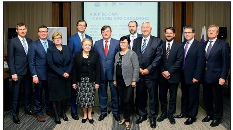
Przedstawiciele organizacji biegłych rewidentów z Polski, Czech, Słowacji i Węgier podczas spotkania w Arłamowie

Tematykę XV Zjazdu zdominowały przede wszystkim kwestie dotyczące unijnej reformy rynku audytorskiego i jej wpływu na rozwiązania prawne w poszczególnych krajach. Uczestnicy dyskutowali na temat podziału uprawnień i odpowiedzialności pomiędzy publicznymi organami nadzoru nad zawodem biegłego rewidenta a samorządami zawodowymi. Innymi omawianymi zagadnieniami były wyzwania związane z wdrożeniem Międzynarodowych Standardów Badania w poszczególnych krajach i związane z tym wsparcie merytoryczne i technologiczne małych i średnich firm audytorskich ze strony krajowych organizacji zawodowych. Ekspert poświęcił też uwagę planowanym zmianom w zakresie rachunkowości i badania sprawozdań finansowych jednostek sektora publicznego.