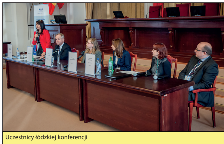
Uczestnicy łódzkiej konferencji

2 grudnia 2014 roku odbyła się konferencja „Optymalizacja procesów biznesowych w gospodarce opartej na wiedzy i cyfryzacji” zorganizowana we współpracy Regionalnego Oddziału Krajowej Izby Biegłych Rewidentów w Łodzi z Biurem Rozwoju Przedsiębiorczości i Miejsc Pracy Urzędu Miasta Łodzi. Konferencja objęta została patronatem honorowym Prezydenta Miasta Łodzi, Marszałka Województwa Łódzkiego, Wojewody Łódzkiego i Najwyższej Izby Kontroli. Wydarzenie sfinansowane zostało ze środków Banku Światowego.