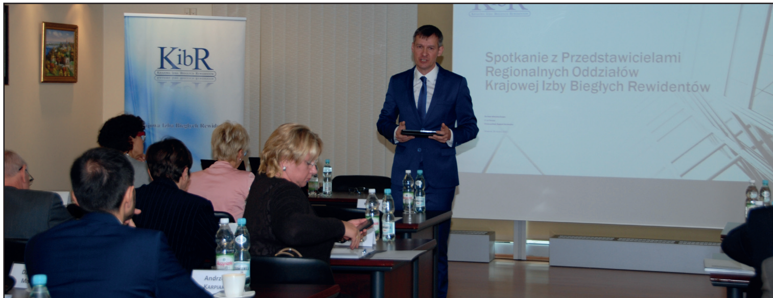
W ramach konsultacji projektu założeń ustawy o biegłych rewidentach odbyło się szereg dyskusji środowiskowych. Na zdjęciu spotkanie w KIBR z przedstawicielami oddziałów regionalnych